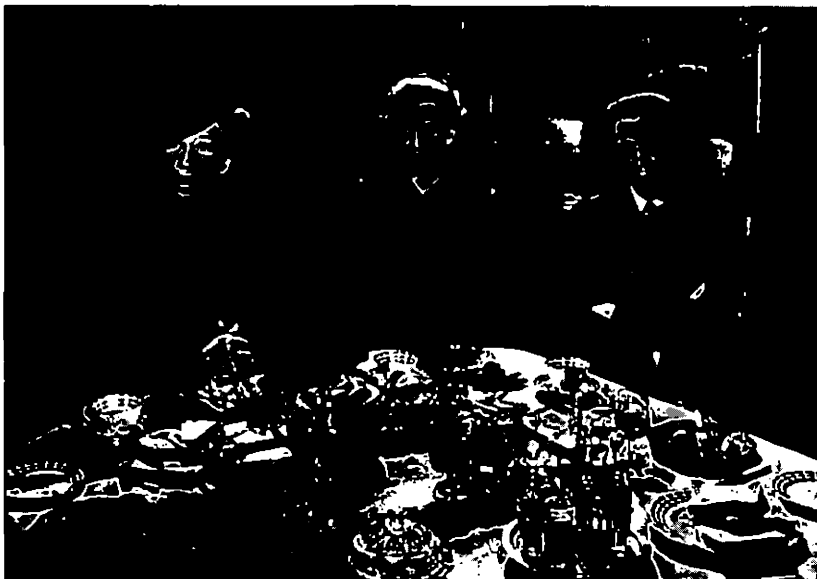
The Loves of Joanna Godden de Charles Frend

raissent soudain comme visibles. Visibles parce que datés. Or, qu'un film puisse être dit daté est loin de constituer une tare. Ce qui est négatif, c'est qu'un film, au moment même de son apparition, soit déjà vieux, déjà dépassé. Mais il arrive un moment où cette question ne se pose plus puisque le film est, de toute façon, un vieux film (comme, disons, aujourd'hui A bout de souffle ). Se pose alors une autre question : porte-t-il sa date avec lui ? Et avec quelle précision ? Et cette date, on la trouve non dans ce qui est permanent mais dans ce qui a changé (en l'occurrence : le studio).